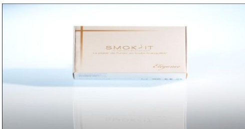
Le coffret Elégance