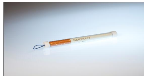
La Jet 400 jetable dans son étui