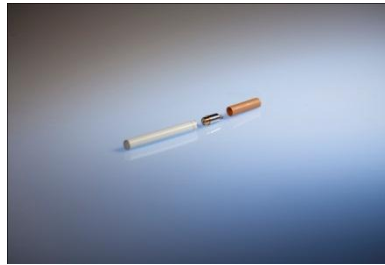
sa cigarette rechargeable