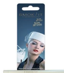
La Slim jetable