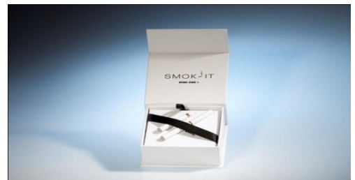
sa cigarette rechargeable