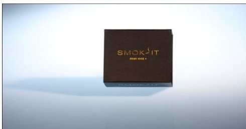
Le coffret Mini One