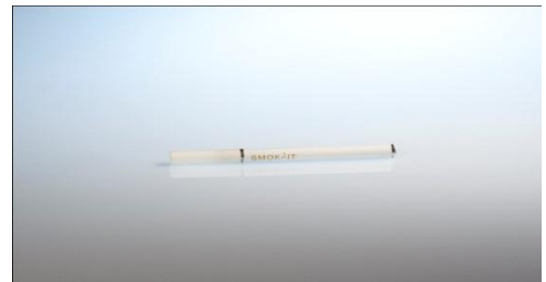
sa cigarette rechargeable slim