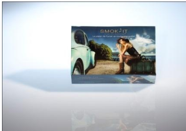
Le coffret Eva Grey